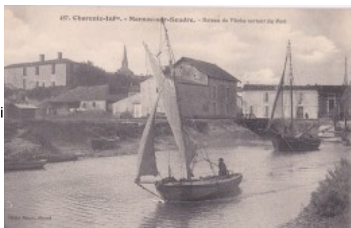
Sortie du port

On peut repérer sur les différentes photos représentatives de l'époque plusieurs de ces yoles parmi la flottille au port ou au mouillage près de l'ancien port des « Rousines » face à une claire ostréicole , une autre quitte le port de Mornac sous voiles par vent de noroît .