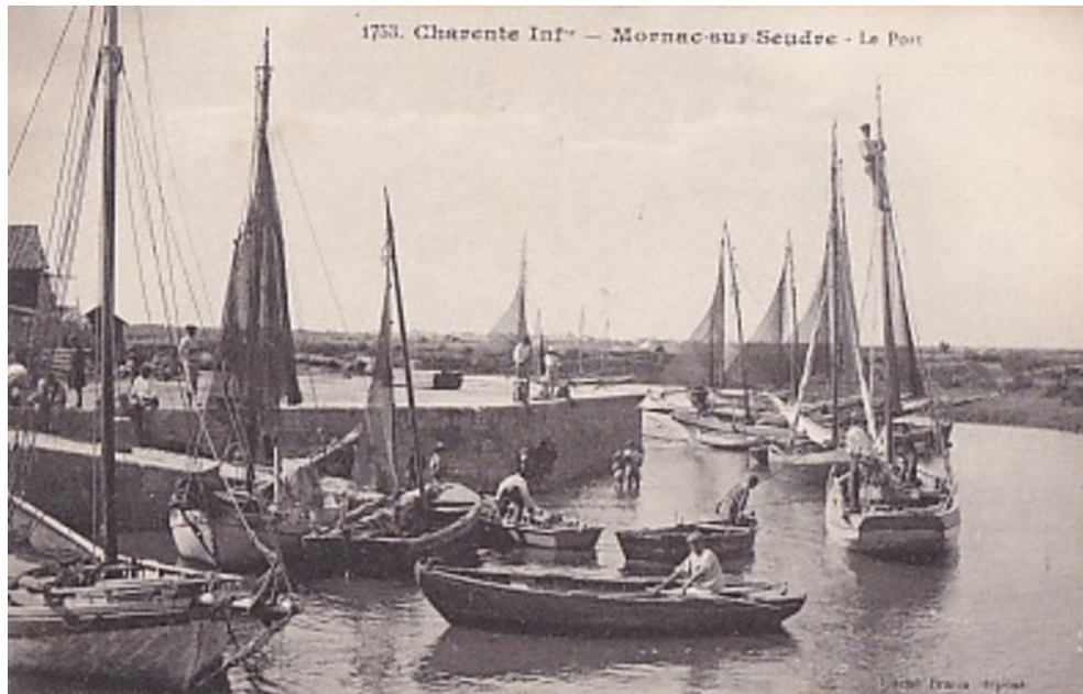
Petite Yole avec les avirons

La tradition orale locale parle de « grandes yoles » ou encore de « yoles à nez de goret » .