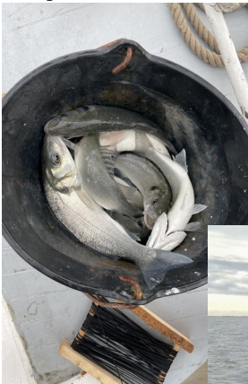
La pêche miraculeuse