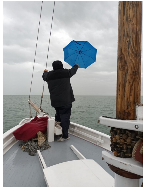
Essai du nouveau spi bleu : Pas concluant !