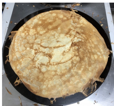
Le résultat du travail de nos crêpières préférées, Dominique et Gwenaëlle : Des crêpes délicieuses.