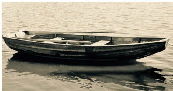
Nez de goret

Ces grandes yoles à tableau arrière étaient alors dotées ici de gréements « à corne », grand-voile et foc, avec bout dehors .